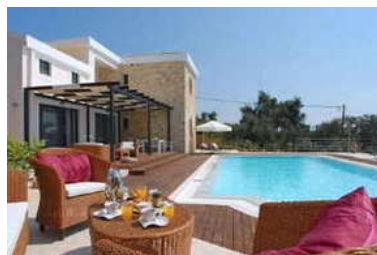
Villa Lefki en ligne